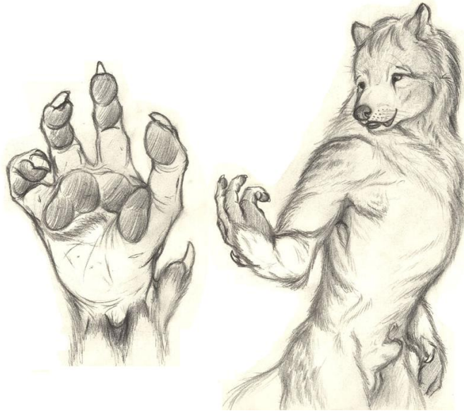
Figure 1: Exemple d'un hybride canin avec une apparence mélangeant des attributs humain et non-humain. Dessin par Alessio Scalerandi, utilisé avec permission.